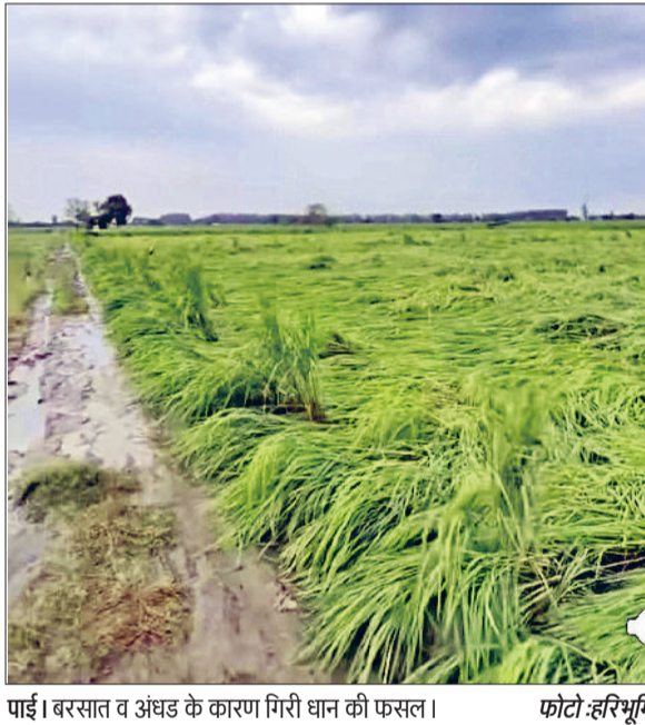
जींद। बारसात व अधड के कारण गिरी धान की फसल।

फूस बरसाने के लिए कैथल रोड पर चार एकड़ जमीन किराए पर ली है, लेकिन मजदूर वहां नहीं जा रहे। उनका कहना है कि उन्होंने इस संबंध में मार्केट कमिटी को कई बार अवगत कराया, लेकिन कोई समाधान नहीं हुआ।