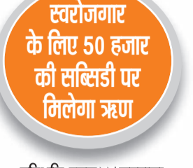
हरिभूमि न्यूज नरवाना

नायब सरकार लागी नई वैकल्पिक रोजगार योजना