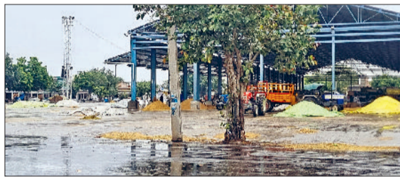
जींद। बारिश के बाद मंडी में भीगती फसल व नागरिक अस्पताल में जमा बरसाती पानी।