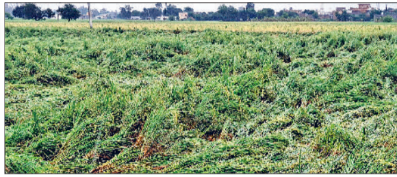
जींद। बारिश के बाद खेत में बिछी फसल।

आठ डिग्री लुढ़का तापमान, गुलाबी ठंड ने दी दस्तक