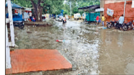
जींद। बारिश के बाद मंडी में भीगती फसल व नागरिक अस्पताल में जमा बरसाती पानी।

मंडियों में फसल भीगी बारिश ने किसानों को परेशानी को बढ़ा दिया है। धान, बाजरा, कपास की फसले खेत से लेकर मंडियों तक फैली हुई है। किसानों को कहना है कि अगर बारिश होती है तो फसलों को काफी नुकसान पहुंचेगा। रात को धूल गरी आंधी के कारण कुछ स्थानों पर धान फसल पसर गई। वहीं बारिश से मंडियों में पड़ी लाखों टिक्टल धान फसल भी भीग गई। फसले मंडियों में खुले आसमान तले पड़ी हुई है। जिले में लगभग चार लाख टन धान फसल की आवक हो चुकी है। उड़द लाख टिक्टल के लगभग धान फसल बिक चुकी है। आवक भी तेजी से हो रही है। बारिश ने कृषि कार्यों पर भी ब्रेक लगा दिया है। मौसम वैज्ञानिक डा. राजेश ने बताया कि पश्चिमी विक्षोभ की सक्रियता से आठ अक्टूबर तक मौसम परिवर्तनशील बना हुआ है। आकाश में बादलवाह के बनी रहने के साथ बारिश की संभावना बनी है। तापमान में भी गिरावट आएगी, किसान मौसम को ध्यान में रख कर कृषि कार्य करें।